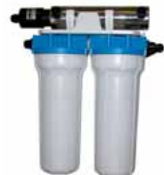
cod. AQ-MICROFILL + cod. AQ-107UV