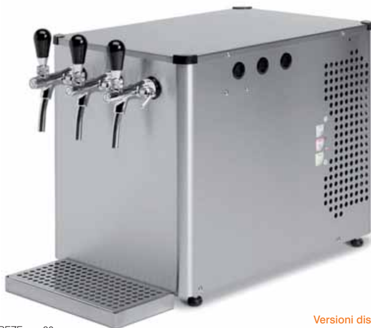
mod. BIOFREZE pro 80 sopra

Composto da un mobile in acciaio INOX AISI 304, dispone di un circuito di refrigerazione SAHARA CLIMA AQUABIO per funzionare con temperature esterne fino a 43°C, e serpentine di raffreddamento estraibili completamente in acciaio INOX, per la massima igiene.